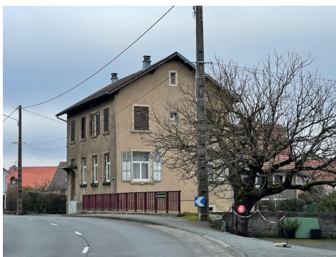
L'ancien CP de Trévenans, (dans le virage de la Grande rue)