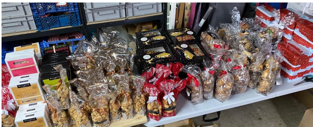
Le tri des 2600€ de marchandise Billiotte nous a pris quelques heures !

Alors nous essayons de contrebalancer cela en travaillant à récolter des fonds pour enchanter le quotidien des petits écoliers de 3 à 6 ans. Depuis septembre, nous avons récolté un bénéfice de 2000€ en proposant à la vente des sacs déco, des pâtisseries de la boulangerie Maître et des chocolats et biscuits de Noël Billiotte. Nous espérons récolter encore 2000€ d'ici la fin de l'année avec une vente de thés, cacao et épices de la boutique belfortaine Les Thés de Bernie, les chocolats de Pâques, et la traditionnelle vente d'objets souvenirs personnalisés avec les dessins des enfants en fin d'année. Ceci nous a déjà permis de financer près de 1000€ de matériel de motricité, 300€ d'abonnements mensuels à des magazines et livres pour enfants, en plus des goûters et participation aux sorties et spectacles régulièrement financés. Et à partir de janvier, les enfants bénéficieront de 6 séances hebdomadaires de Yoga par classe, entièrement prises en charge par l'association !