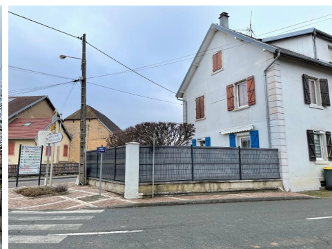
Dans ce jardin se trouvait l'école de la petite gare

Voici une première photo de classe d'il y a presque 100 ans avec l'instituteur M. Navion, devant l'actuelle école élémentaire :