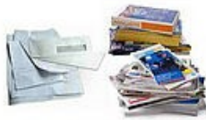
Tous les papiers, journaux, magazines