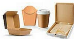
Les emballages de fast food