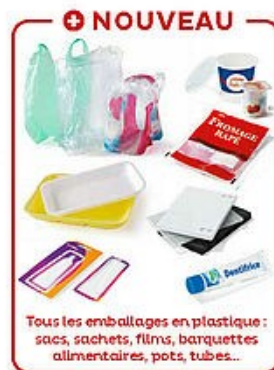
NOUVEAU Tous les emballages en plastique : sacs, sachets, films, barquettes alimentaires, pots, tubes...