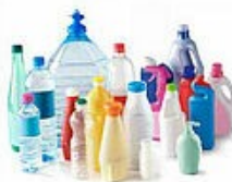
Les bouteilles et flacons en plastique