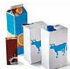
Les briques alimentaires (de lait, crème, soupe, jus de fruits...)