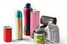
Les boîtes de conserve, bidons de sirop, canettes, aérosols, barquettes alu...