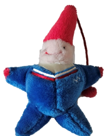
« Magique », la mascotte 1992 conservée par Yolande Nijak

Les anciens s'en souviennent, et les jeunes de l'époque ont certainement été marqués par cet événement unique : la Flamme Olympique est passée par notre village, dans la grande rue, au matin du 10 janvier 1992 !